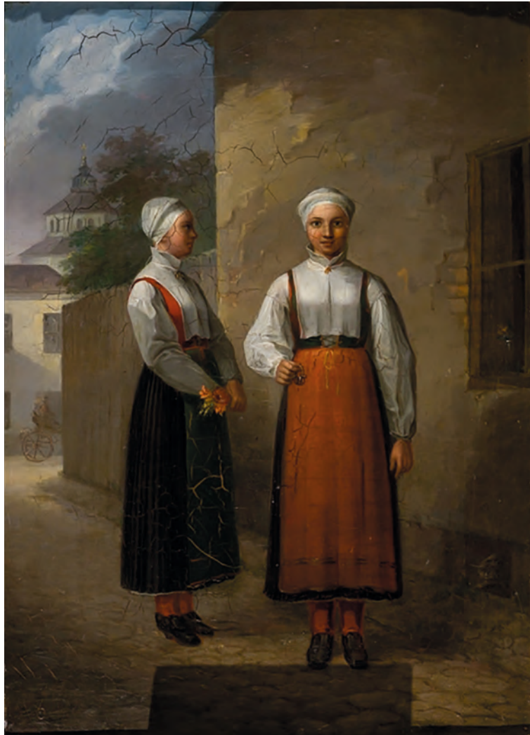
DETALJ.