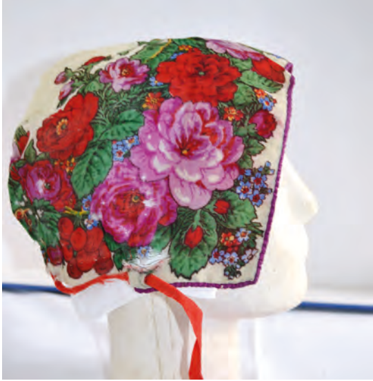
Roshätta av yllemuslinssjal. Privat ägo

konstnären Gustaf Ankarcrona (1869–1933). (Ibid.) Såväl nymodigheter i dräktskicket som judiska aktörer lär ha stuckit i ögonen på den man som beklagade att Nationalmuseum hade köpt in Isaac Grünewalds ”rot- och hemlösa schackrar-konst.” (För en genomgång av de antisemitiska påhoppet på Grünewald, se Grünewald 2011.) Att sådana reaktioner ingalunda bara kan hänföras till tidsandan framträder då man ser Carl Larssons reaktion på påhoppet på Grünewald den 11 maj 1918 i Nya Dagligt Allehanda :