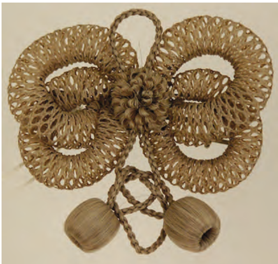
Brosch, hårbete från Vämhus. Dalarnas museum (DM 6665).