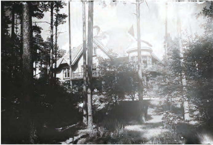
Skogsudden innan ombyggnationen. Dalarnas museum (DM KA149).