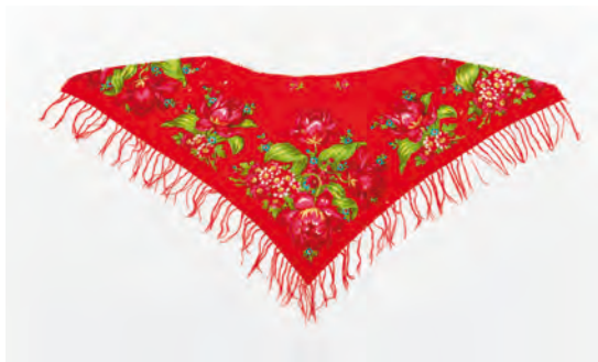
Rosenmönstrat yllemuslinhalskläde, Mockfjärd. Dalarnas museum (DM 07655).

inom Övre Dalarnas dräktskick. Denna textiltyp är både avgjort utsocknes och i allra högsta grad del av svenska judars typiska ekonomiska nisch (se Henschen 1992; Bondjers 1982). Snarare än att vara resultatet av kulturell isolation kan Övre Dalarnas flerhundraåriga sockendräkter ses som produkten av en växelverkan mellan lokalt och globalt. Münnichs yllemusliner bygger vidare på de äldre köpta kattunerna som ett möte mellan judiska näringsidkare och lokal dalsk kultur.