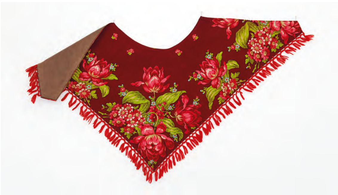
Rosenmönstrat yllemuslinhalskläde, Dala-Floda. Dalarnas museum (DM 25806).

samling folkliga textilier från Nås i Västerdalarna. Där omtalas: