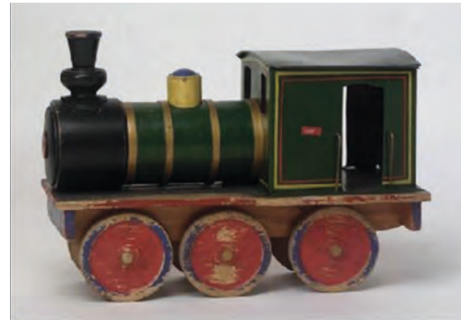
Leksakslok från familjen Münnich. Nordiska museet (NM.0281806)

Fastigheten kom så småningom att tillfalla Birgittasystrarna i Falun då den Allra Heligaste