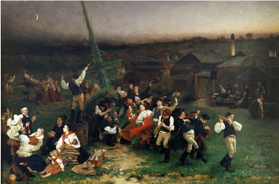
Majstången reses i Rättvik, av Hugo Salmson. Dalarnas museum, Ragnar och Birgit Åhléns stiftelse för konst i Dalarna (ÅH 0002).

Dalarna 1918–1919 och Bertil Lundman, återigen med Lärka som fotograf, genomförde en ny rasundersökning 1932. Dessa rörde egentligen inte judar men var del i ideologiska vindar som kraftigt påverkade judiska livsvillkor i Europa och som inom kort kom att leda fram till grundandet av kibbutzen i Falun och flyktningmottagningen i Grangärde,